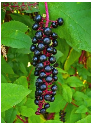
Figure 1. Grappe de baies