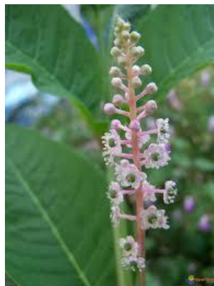
Figure 2. Fleurs blanc / rose en grappe