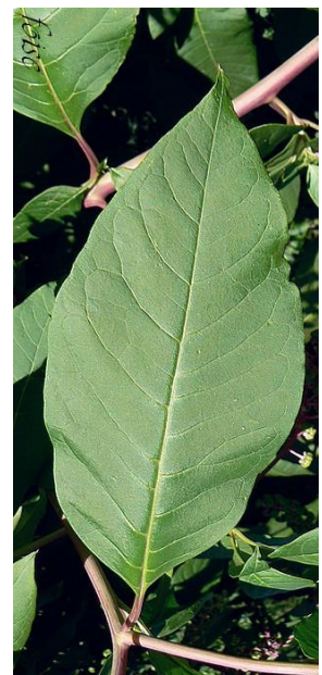
Figure 4. Feuille ovale longue à bord lisse