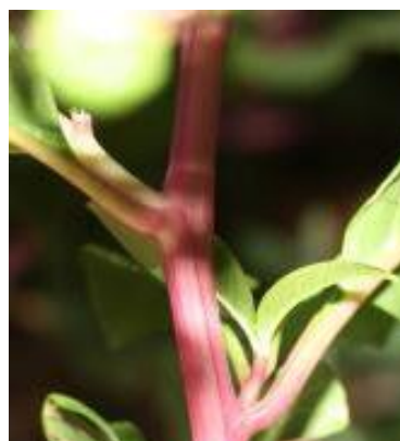
Figure 3. Tige rougeâtre à rose fuchsia