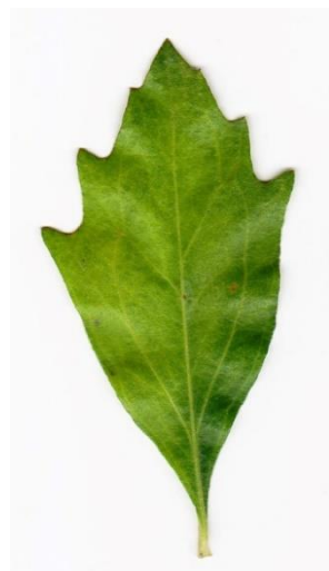
Figure 2. Feuilles dotées de trois dents à leur extrémité