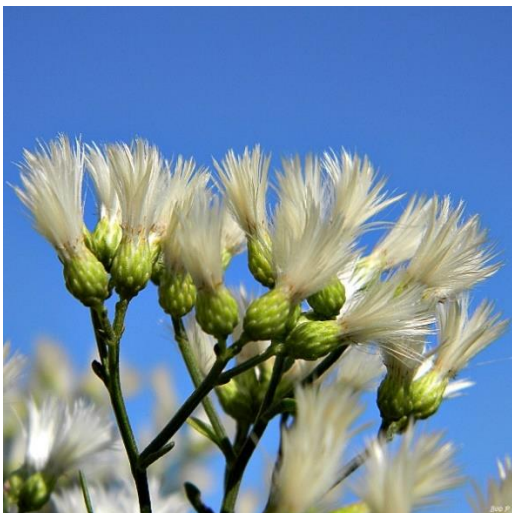
Figure 1. Fleurs nombreuses avec un aspect en plume