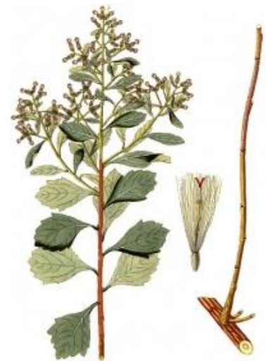
Figure 3. feuille disposée de manière alterne sur les tiges