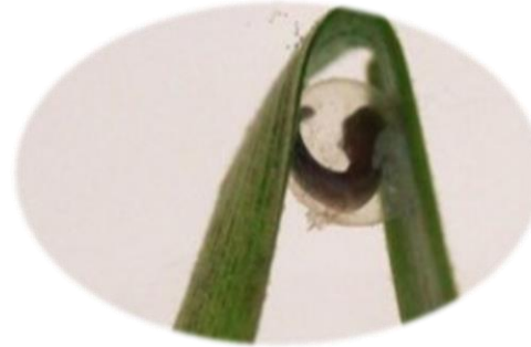
œuf de triton