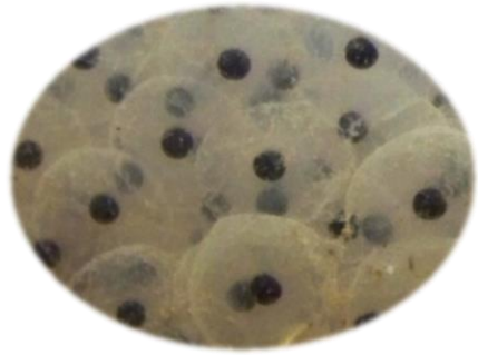
œuf de grenouille